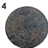
Pièce de l'an 5