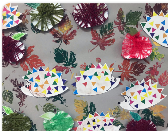
Ecole Le Marronnier : les hérissons