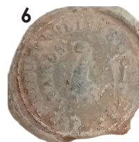
Scellé de sac