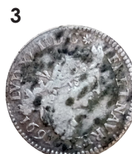
Pièce Louis XIV